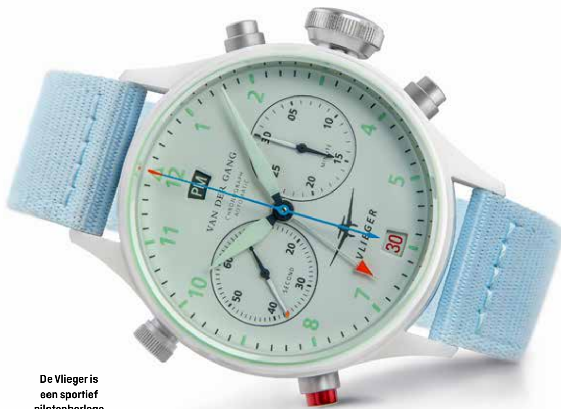
De Vlieger is een sportief pilotenhorloge