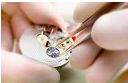
Het blauwe plaatje toont de maanfase