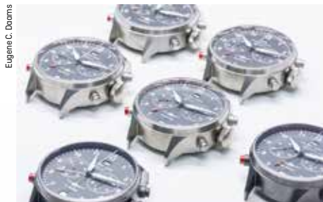
Van de Vlieger worden 999 stuks gemaakt