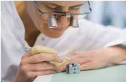
Een horlogemaker bevestigt een onderdeel