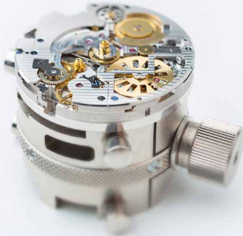
Het eewwurende uurwerk in voorbereiding