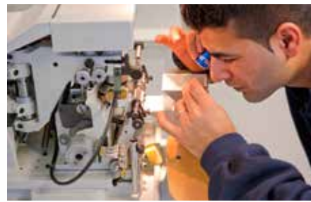
Bij Van der Gang werken twintig mensen